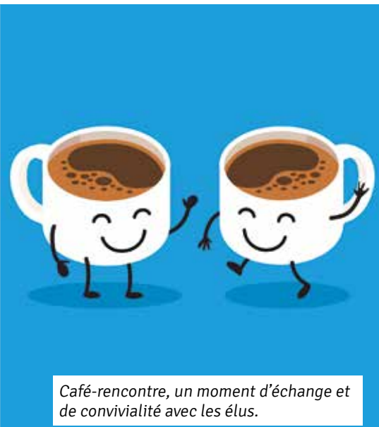
Café-rencontre, un moment d'échange et de convivialité avec les élus.